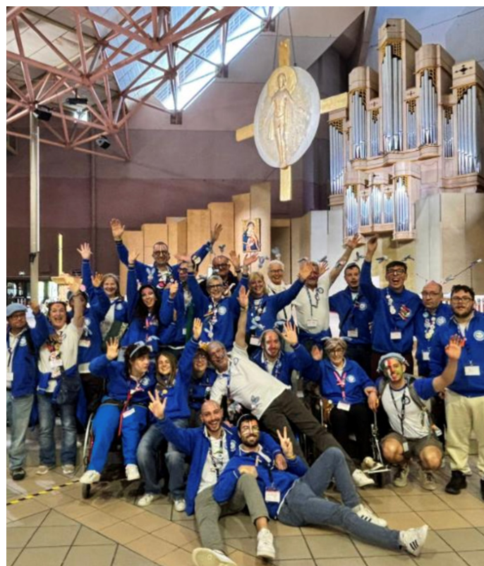
IL NOSTRO GRUPPO DURANTE LA TRUST MASS

Questa settimana è un grande dono, è generosità reciproca, è fiducia, è gioia, è gratitudine, è amore, è luce, E' VITA! Allora, come dice il nostro inno, non smettere mai di brillare!