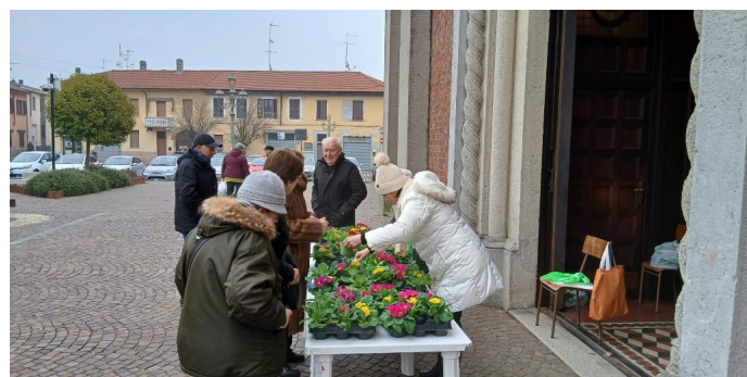
DOMENICA 1° FEBBRAIO 2026 "GIORNATA PER LA VITA" VENDITA PRIMULE PER IL CENTRO AIUTO ALLA