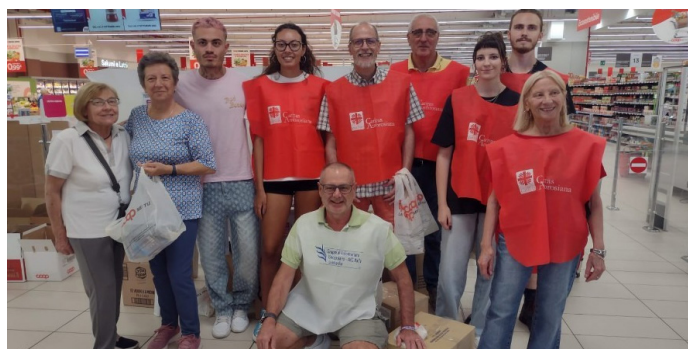
6 SETTEMBRE 2025 "DONA MATERIALE SCOLASTICO" PRESSO LA COOP DI PARABIAGO.