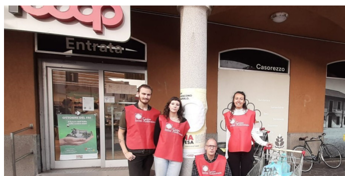
11 OTTOBRE 2025 "DONA LA SPESA" PRESSO LA COOP DI CASOREZZO.