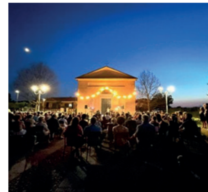
ALCUNI MOMENTI DEL CONCERTO TRIBUTO A MIA MARTINI