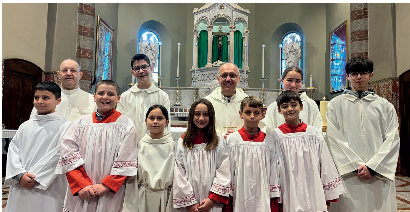
VESTIZIONE DEI CHIERICHETTI - 9 NOVEMBRE 2025