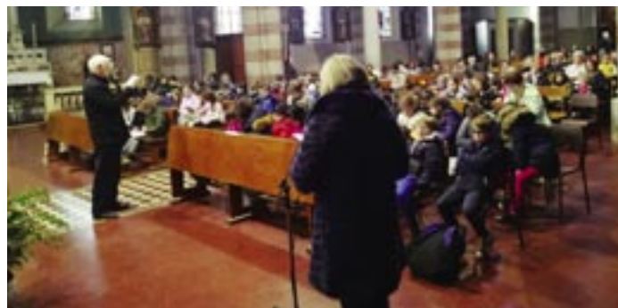
La Via Crucis del venerdì