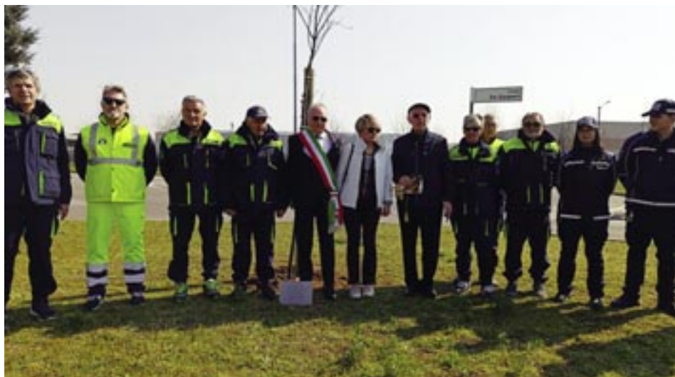
18 Marzo: Giornata in memoria delle vittime del Covid. Benedizione, preghiera e posa dell'albero.