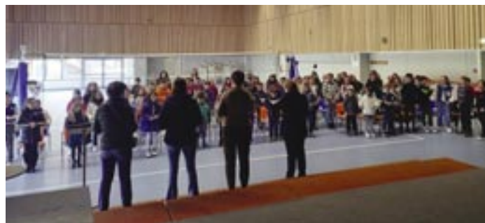
Le domeniche di Quaresima