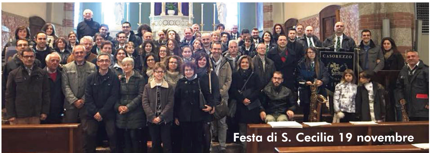
Festa di S. Cecilia 19 novembre

Il Comitato, continuerà a mettere in atto tutte quelle azioni volute a scongiurare l'attuazione del progetto autorizzato e vi da appuntamento al FALÒ DI SANT'ANTONIO e alle prossime manifestazioni in programmazione per ribadire a politici e istituzioni: NO ALLA DISCARICA NEL PARCO DEL ROCCOLO !!!