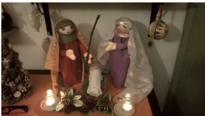
Le riflessioni dei genitori davanti alla Natività