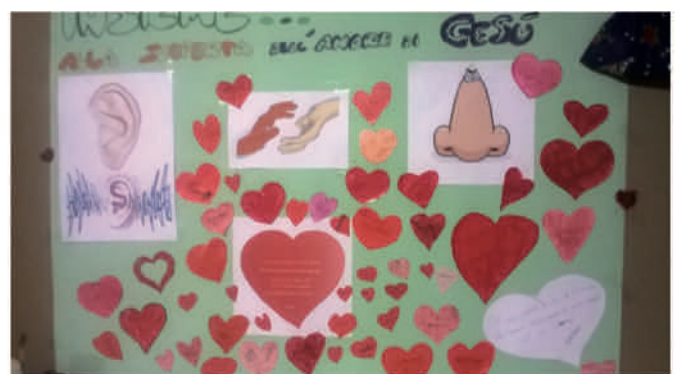
Il nostri percorsi a catechismo