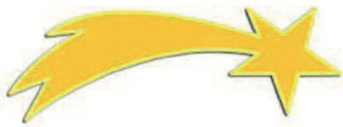
La preghiera nei cortili

Seguendo la Stella....che bello il nostro cammino verso il Natale!