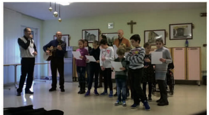
L'incontro con i nonnini in Casa Famiglia