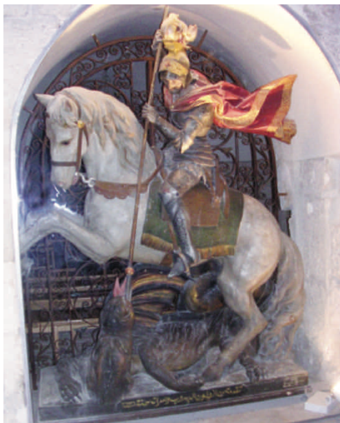
La foto della statua di S. Giorgio che si trova a Lydda suo luogo d'origine

Ciò che conta è che il culto del patrono sia di stimolo ad una professione della stessa fede col coraggio dei martiri. E lui dal cielo ci può dare una mano.