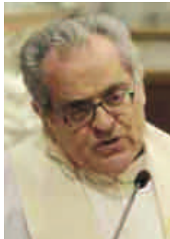
Mons. Giuseppe Angelini è docente di Teologia morale alla Facoltà teologica dell'Italia settentrionale. È parroco di San Simpliciano a Milano

La Madre non si illuse; non dimenticò l'incidente; serbava invece tutte queste cose nel suo cuore. E attendeva il tempo nel quale esse sarebbero divenute chiare le cose oscure. Ci può aiutare questa suggestiva pagina di Luca a comprendere il senso di quel black out quasi inevitabile, che si produce tra genitori e figli pressappoco a partire dai 12 anni? Certo, è di conforto sapere che anche nella famiglia di Nazareth s'è prodotta questa incomprendimento. È documento del fatto che l'incomprendimento tra genitori e figli in quella fase della crescita non è soltanto il riflesso degli errori che fanno genitori e figli. Non è sempre e di necessità riflesso di errori. È anche una necessità. La casa nella quale il figlio nasce e vive la prima età della vita non può rimanere la sua dimora per sempre. L'accoglienza che egli ha conosciuto in quella prima dimora rimane un presidio sicuro per tutto il cammino successivo. E tuttavia la verità di quella prima accoglienza