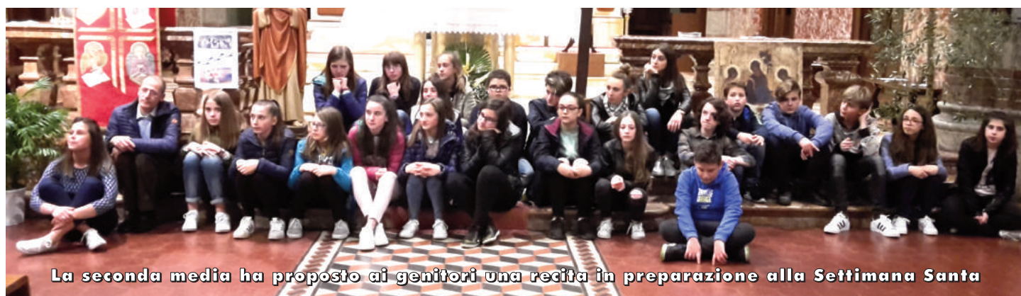
La seconda media ha proposto ai genitori una recita in preparazione alla Settimana Santa